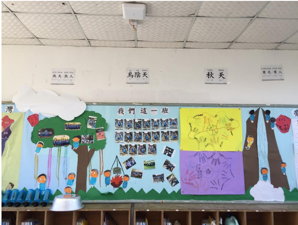
說明：801 班級教室佈置