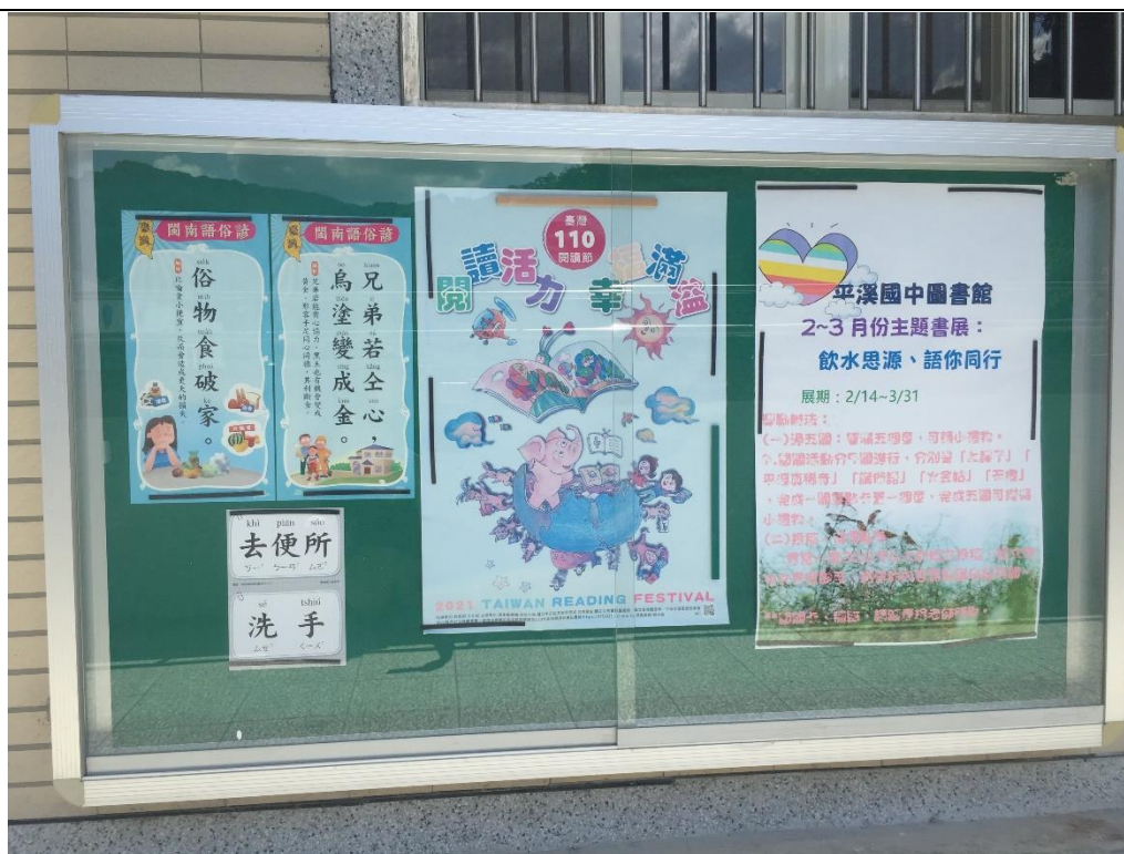
說明：圖書館走廊公佈欄 2-3 月主題活動宣導與佈置