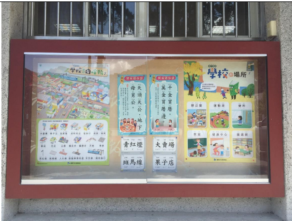
說明：教務處走廊公佈欄佈置