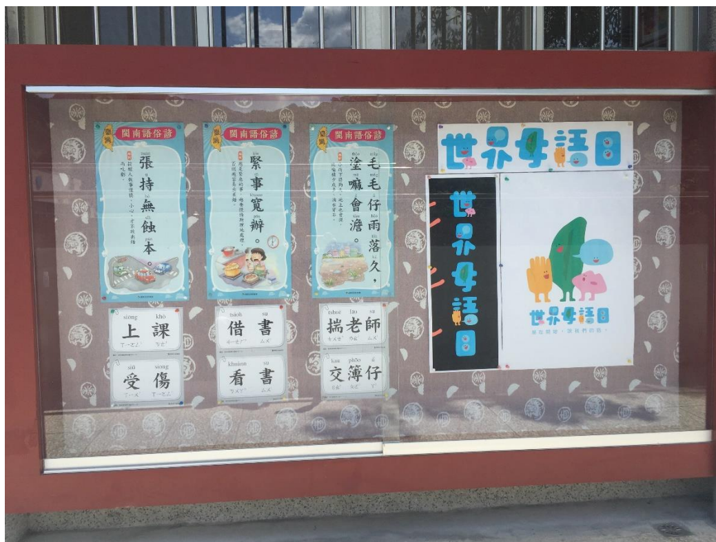
說明：圖書館走廊公佈欄 2-3 月主題活動宣導與佈置