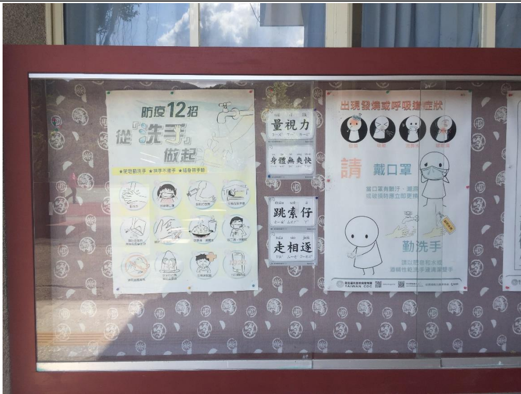
說明：健康中心走廊公佈欄佈置