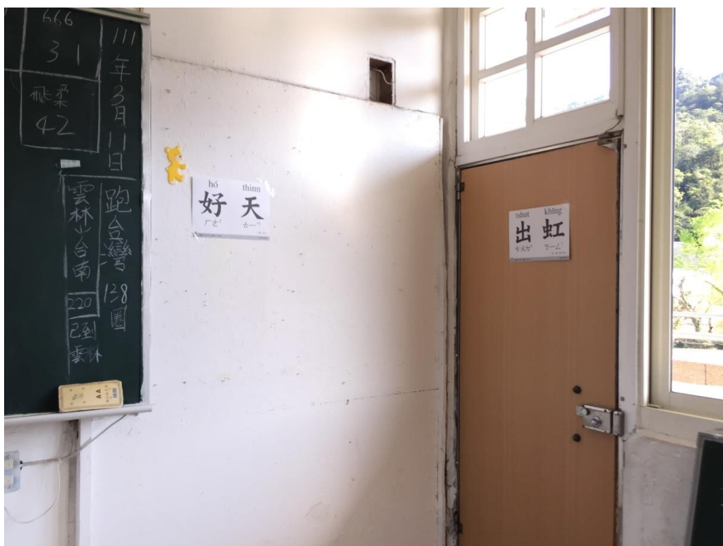
說明：801 班級教室佈置