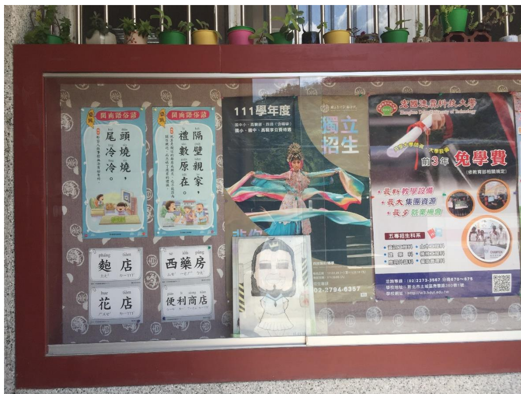
說明：慈輝辦公室走廊公佈欄佈置